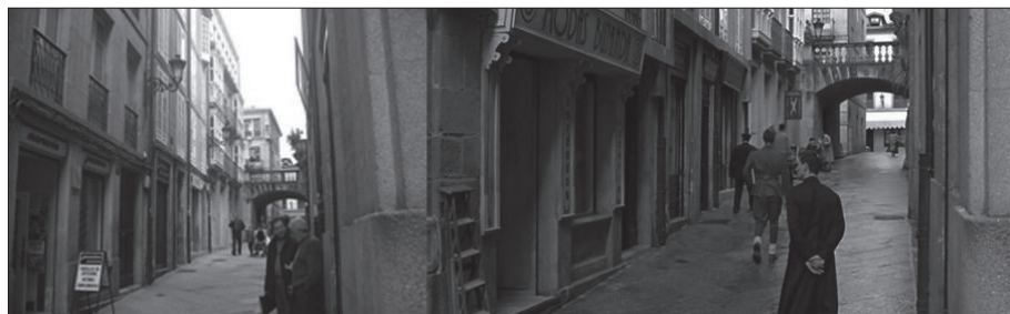
Fonte: Turismo de Ourense (Inorde) e frame extraído de Los Girasoles Ciegos .

Exemplo 3. Mosteiro de San Clodio. A estrutura e o deseño dos soportais, o patio interior (lugar común para a celebración de vodas) e a árbore fan perfectamente identificable o espazo aínda que non se mencione (ver Imaxe 3).