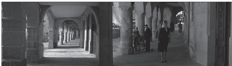
Imaxe 5. Balconadas da Praza Maior.

Fonte: Turismo de Ourense (Inorde) e frame extraído de Los Girasoles Ciegos .