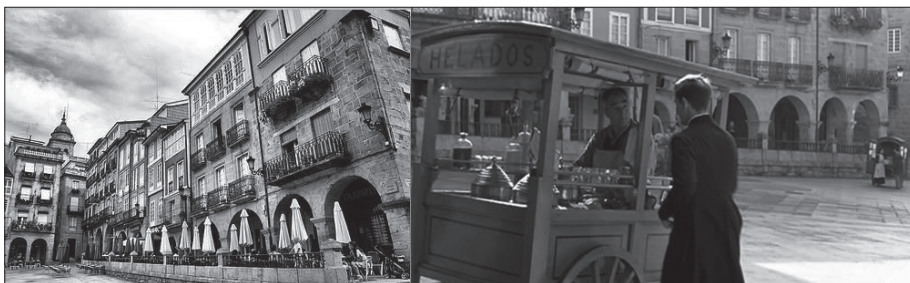
Imaxe 4. Praza Maior.