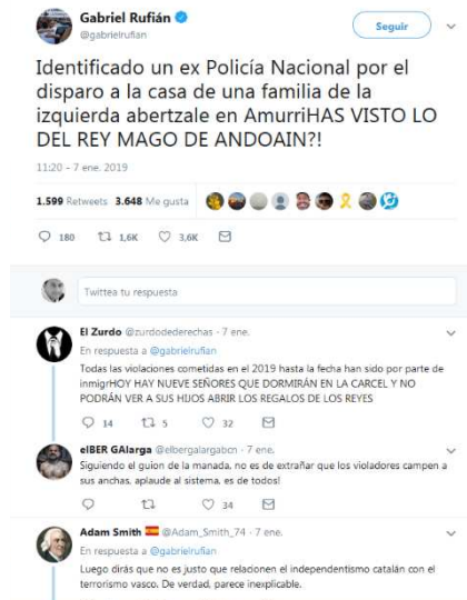
Figura 2. @gabrielrufian

Introduce otro tema que va a generar gran cantidad de interacciones y se va a convertir en uno de los hilos principales de la red analizada.