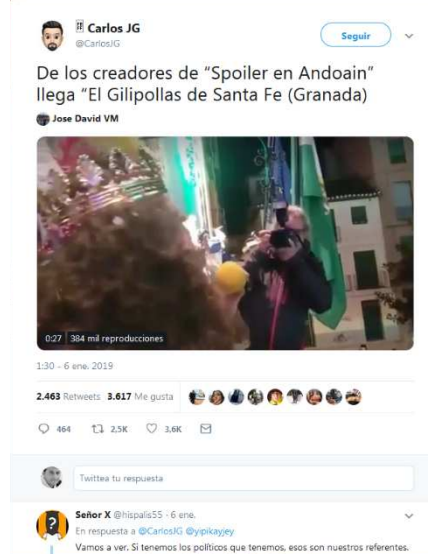
Figura 5: @CarlosJG