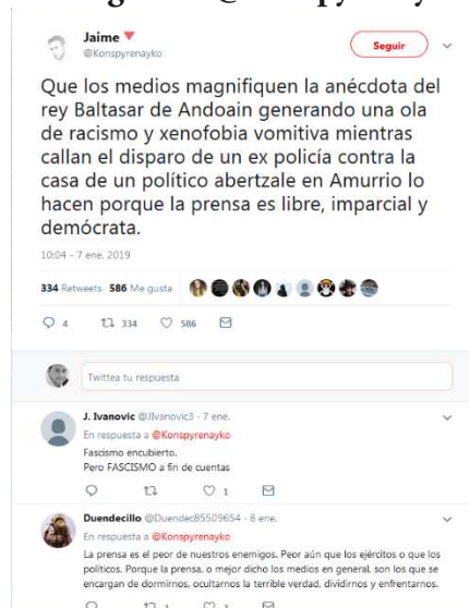
Figura 3: @Konspyrenayko