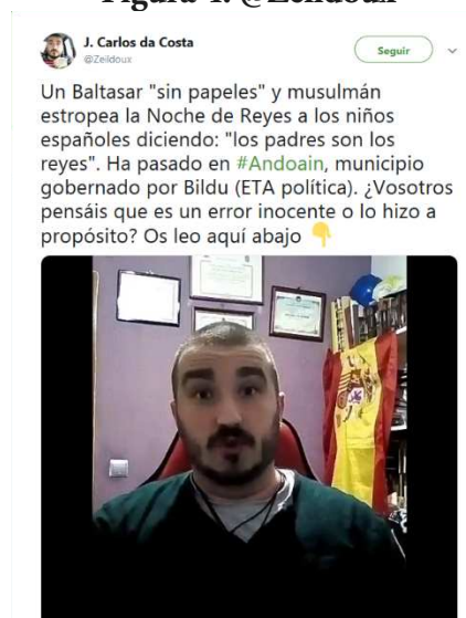
Figura 4: @Zeildoux